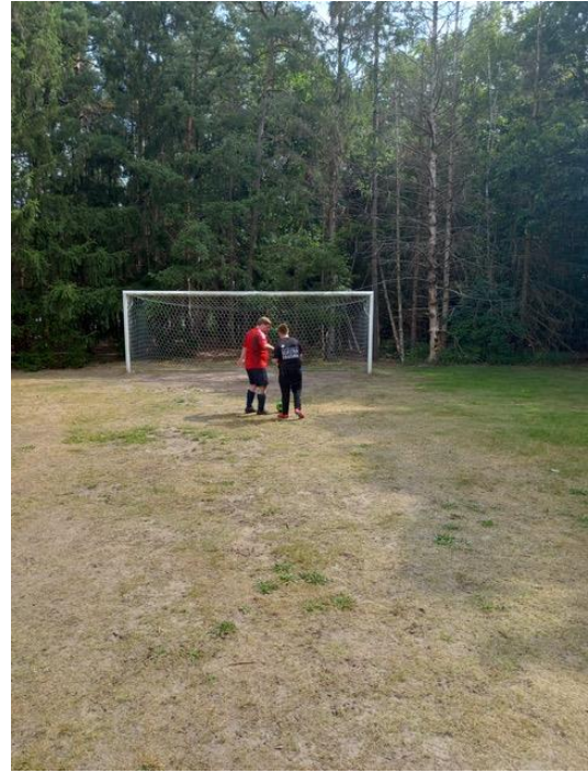
keepersoverleg Lex en Collin