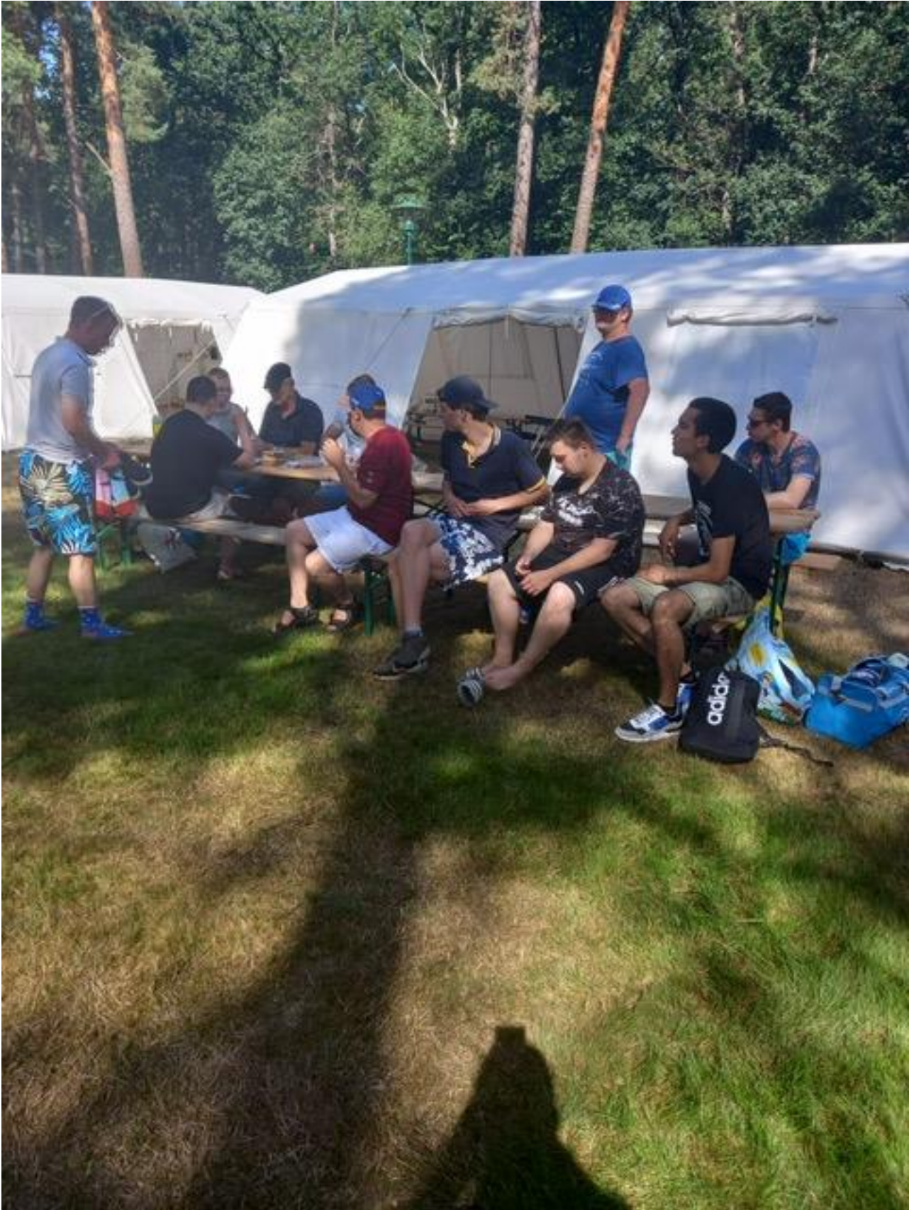
bijkomen van al dat sporten.