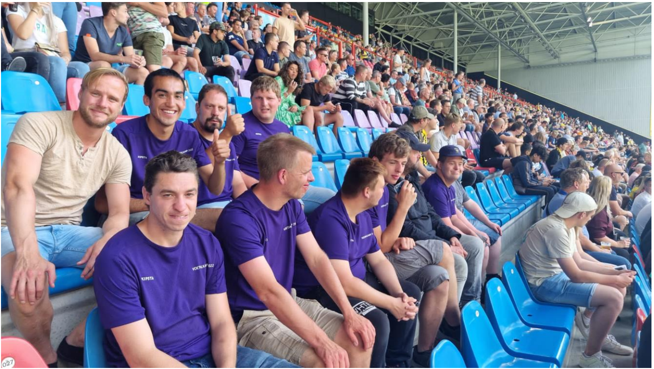
bijna volle bak

Na afloop wat Vitesse spullen gekocht, een Vitesse schriftje en een petje gaan over de toonbank. Onze hete bus staat klaar om ons naar het verkoelende zwembad te brengen.