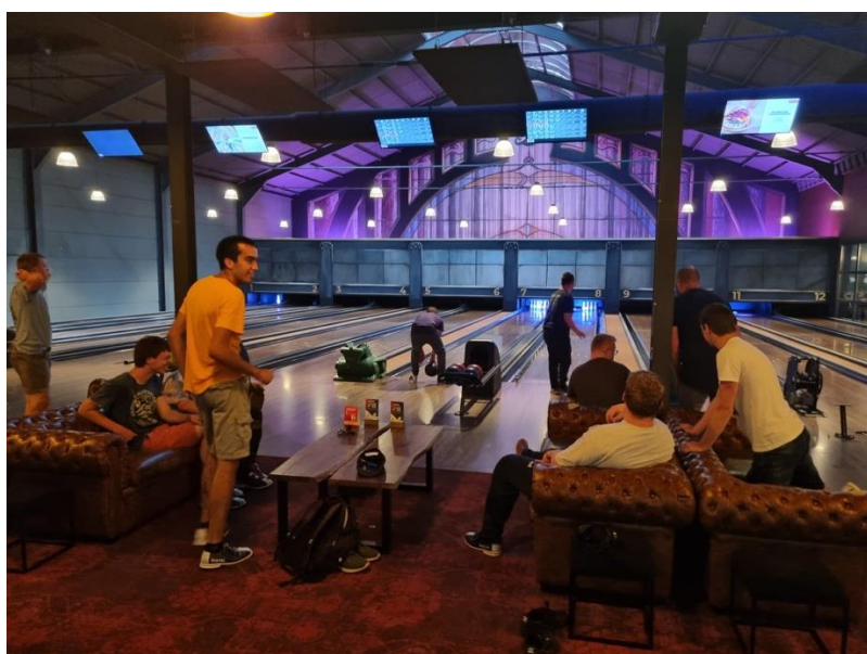
lekker koel en cool bowlen