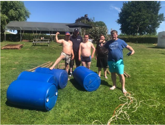
team 1 Massa

Heerlijk aanklooiën in de zon, af en toe een drankje in de schaduw. Tussen door een broodje. Wat een feest.