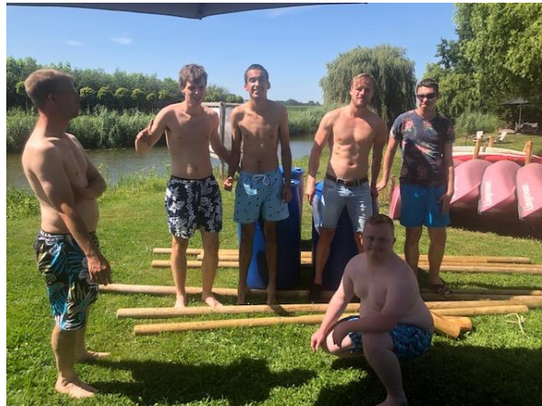
team 2 Pier