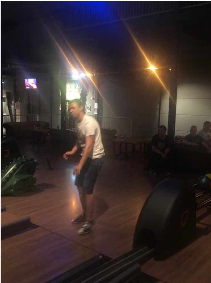
actie zonder bal