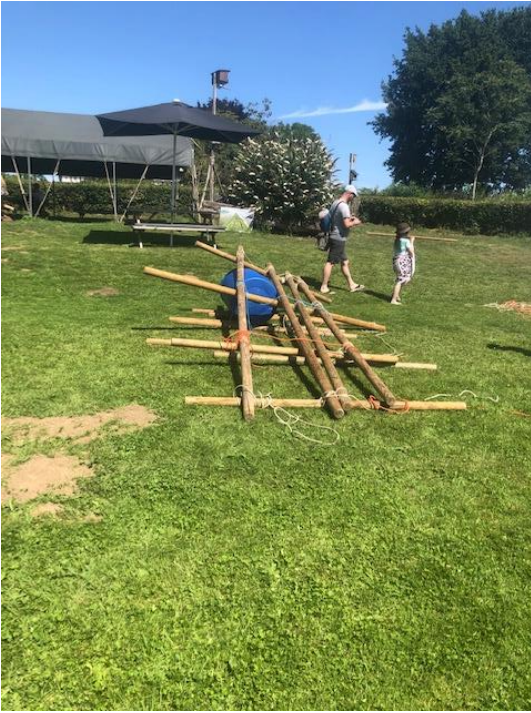
het begin is er