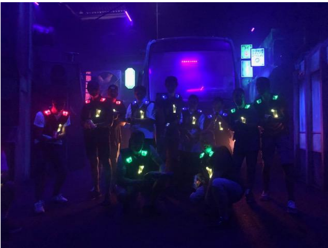
start van het lasergamen