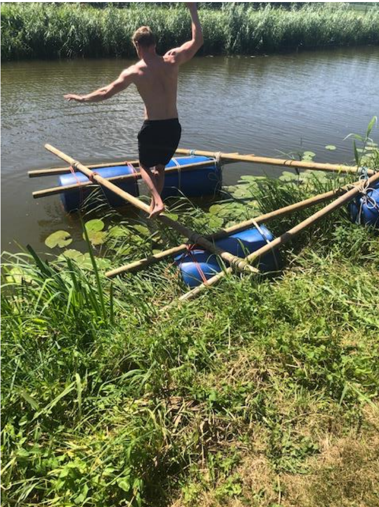
“oeps” loopplank vergeten